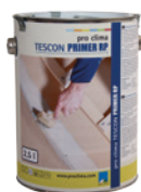
TESCON PRIMER RP Pohjustusaine