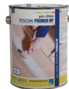
TESCON Primer RP Pohjustusaine