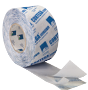
CONTEGA SOLIDO SL Liitosnauha sisäpuolelle