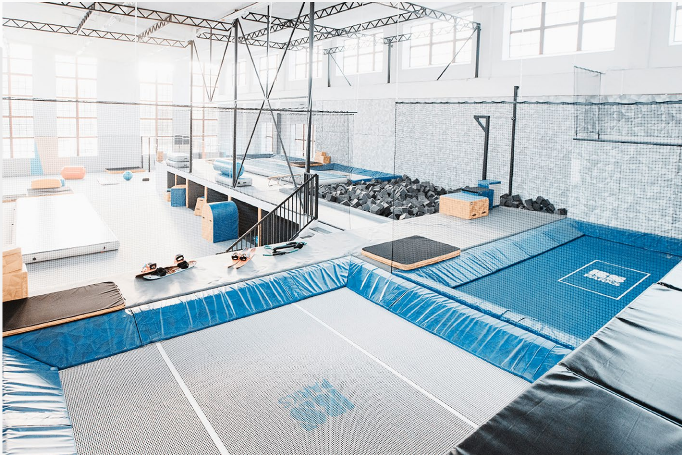
Luova liikuntasali Reenis, Oulu