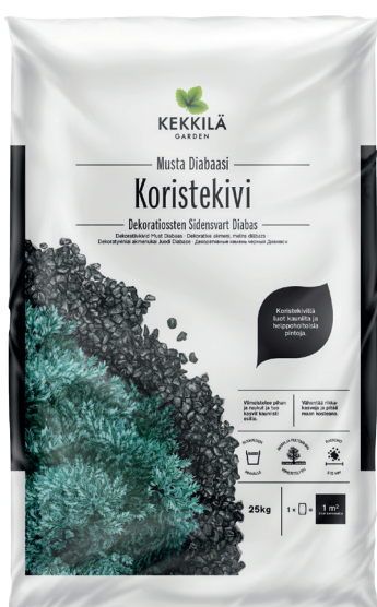
Pakkauskoot 25 KG