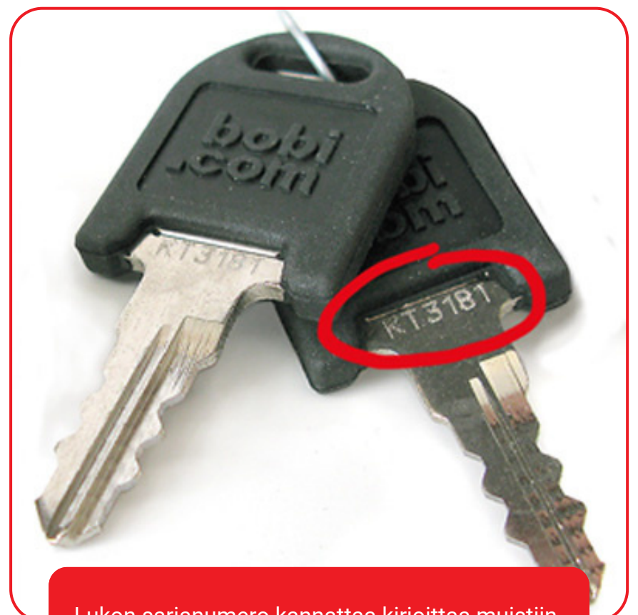
Lukon sarjanumero kannattaa kirjoittaa muistiin.