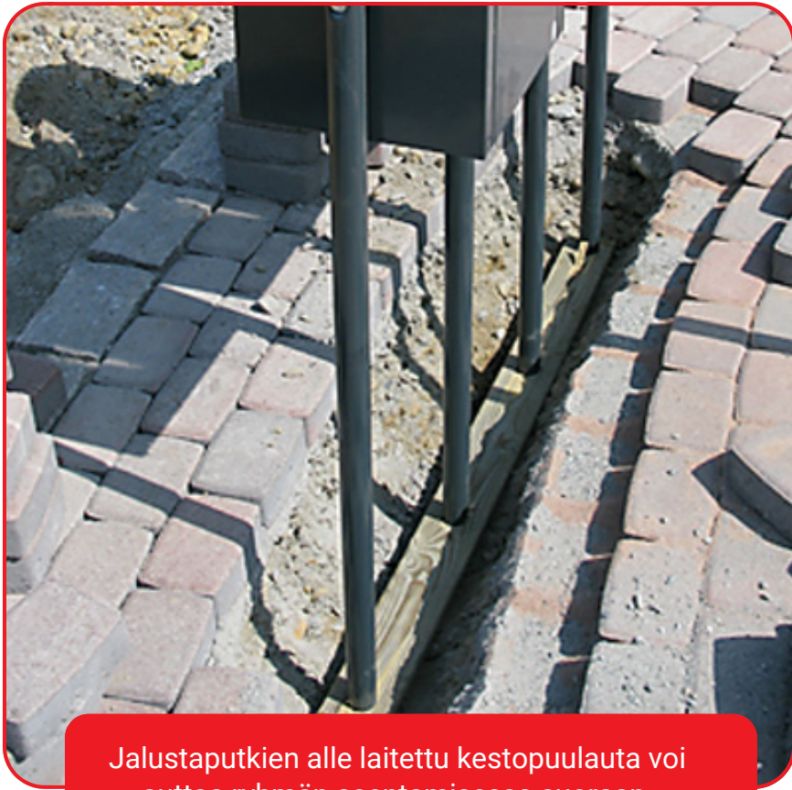
Jalustaputkien alle laitettu kestopuulauta voi auttaa ryhmän asentamisessa suoraan.