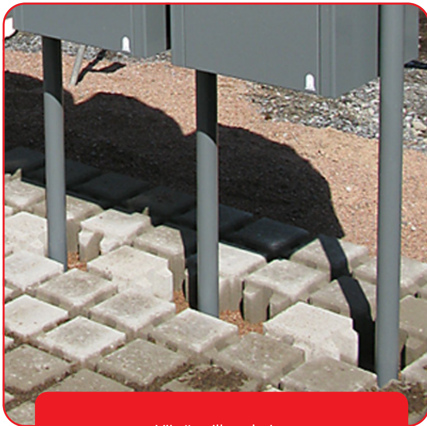
Viittä vaille valmis.