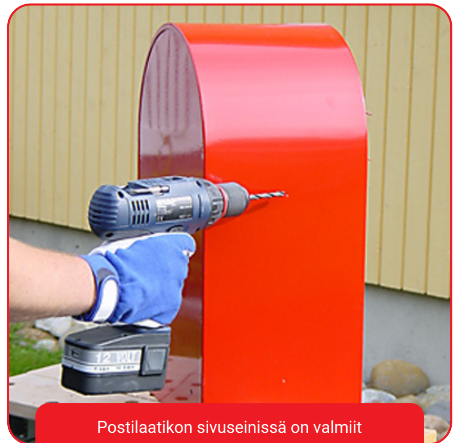
Postilaatikon sivuseinissä on valmiit kiinnitysreikien aihiot.