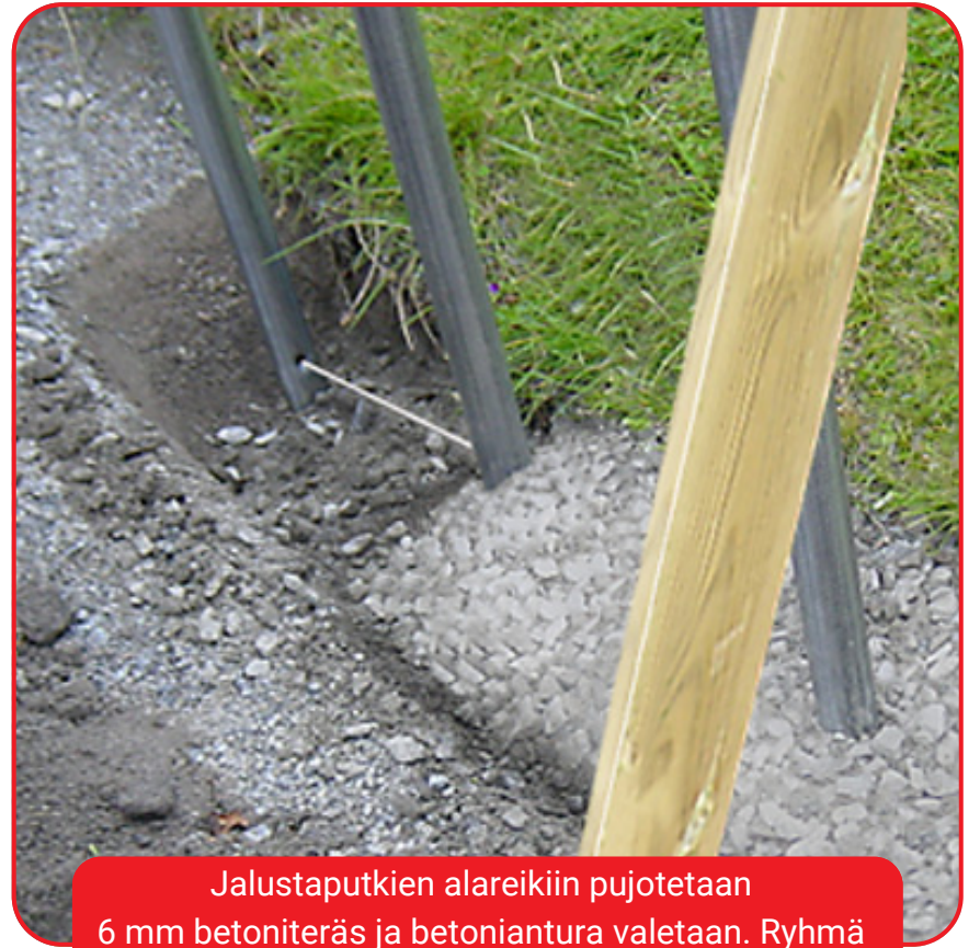
Jalustaputkien alareikiin pujotetaan 6 mm betoniteräs ja betoniantura valetaan. Ryhmä tuetaan suoraan kunnes valu kuivuu.