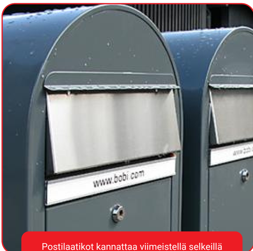
Postilaatikot kannattaa viimeistellä selkeillä nimikilvillä.