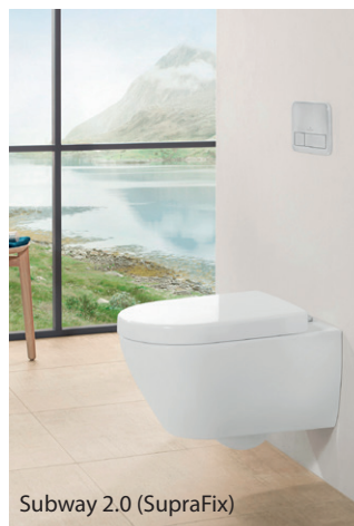
Subway 2.0 (SupraFix)

ViFresh-toiminto on WC-raikastimien annostelua helpottava integroitu lisävaruste Subway 2.0 WC-istuimiin. Sen piilotettu raikastinsäiliö on helppo täyttää koskematta epähygieenisiin alueisiin. ViFresh-lisävaruste takaa WC-istuimen täydellisen ja esteettömän huuhtelun, toisin kuin huuhtelutoimintoa haittaavat WC-raikastimet. ViFresh-säiliöön voidaan lisätä kaikkia yleisimpiä WC-raikastimia.