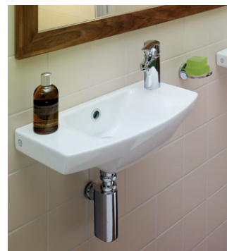
Pesuallas Logic 5197, 500x265 mm