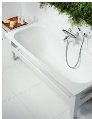
Kylpyamme 1571, 1570x700 mm, paneeliton kehikko

Gustavsbergin upotettavia kylpyammeita on saatavana monia eri malleja ja kokoja. Kaikki Gustavsbergin upotettavat kylpyammeet ovat saatavana pintakäsiteltynä (GlazePlus), mikä auttaa suojaamaan ammetta lialta ja kalkkisaostumilta. Valittavana on myös toimiva liukuestekäsittely, joka tekee ammeesta turvallisemman.