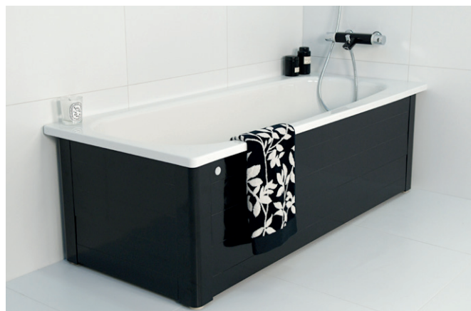
Kylpyamme 7016, 1600x700 mm, kokopaneelikehikko

Pieneen tilaan mahtuvat istuma-ammeet valmistetaan korkealaatuisesta emaloidusta teräksestä ja niiden elinikä on pitkä. Glaze-Plus-pintakäsittely helpottaa istuma-ammeen siivoamista, sillä se auttaa suojaamaan lialta ja kalkkisaostumilta.