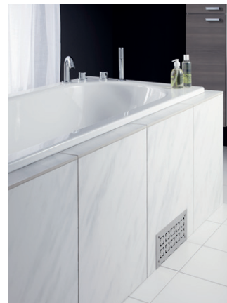
Upotettava amme 3970, 1700x700 mm