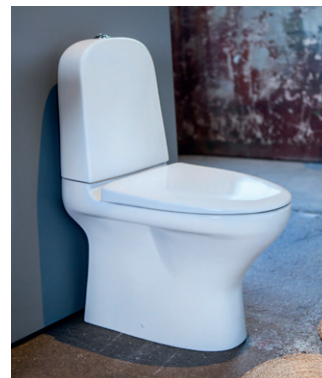
WC-istuin Estetic 8300, mattavalkoinen