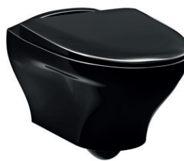
Seinä-WC Estetic 8330