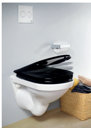
Istuinkannessa Soft Close -toiminto