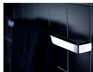
G1-sarjan WC-paperiteline, hylly, pyyhkekoukut ja pyyhetanko