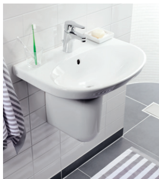
Pesuallas Nautic, posliinikupu 2930

Vesilukon peittävä pesuallasjalka tai -kupu on hyvä ratkaisu, jos suuremmalle kalusteelle ei ole tilaa. Erittäin pienissä pesualtaissa siisti vesilukko voi olla ratkaisu. Vesilukko sopii myös suurempiin pesualtaisiin, niitä on saatavana sekä seinä- että lattialiitoksella.