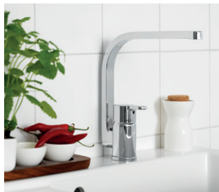
Keittiöhana Nordic 3