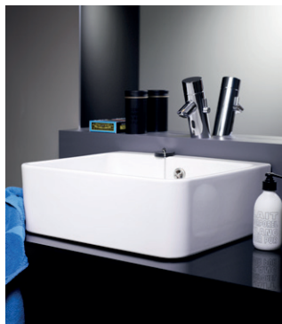
Kaatoallas 6322 99, 600x500 mm