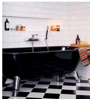
Tassuamme 6368, 1680x730 mm

Gustavsbergin tassuammeiden ulkonäkö on ainutlaatuinen ja trendikäs. Ammejalat ovat helppo vaihtaa ja niitä on saatavana valkoisina, mustina ja kromattuina. Tassuammeet ovat vapaasti seisovia ja sen vuoksi helppoja siivota. Kylpyammeita on saatavana liukuestekäsiteltynä sekä pintakäsittelyllä (GlazePlus), joka helpottaa ammeen puhdistamista. Ammeet valmistetaan emaloidusta teräksestä.