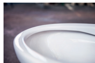
Estetic-istuin, Hygienic Flush -toiminto