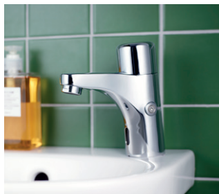
Pesuallashana Nautic, elektroninen

Gustavsbergin pesuistuinhanoissa on säädettävä mukavuusvirtaus ja -lämpötilaominaisuus, joka mukautuu vaivattomasti tarpeiden mukaan. Molemmat toiminnot ovat säädettävissä. Pesuistuinhanan palloniveellä varustettu poresuutin ohjaa veden suuntaa ja helpottaa intiimihygieniasta huolehtimista.