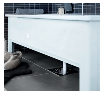
Kylpyamme 1603, 1600x700 mm, puolipaneelikehikko