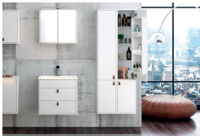
Graphic allaskaappi, korkea kaappi ja peilikaappi

Gustavsbergin laaja vedinvalikoima sopii kaikkiin Graphic- ja Artic-kaappeihin. Nordic 3- ja Nautic-sarjoissa on omat vakiovetimet.