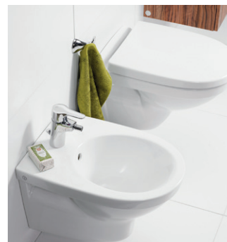
Seinä-pesuistuin Nautic 5598, Seinä-WC Nautic 5530