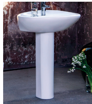
Pesuallas Estetic, posliinijalka