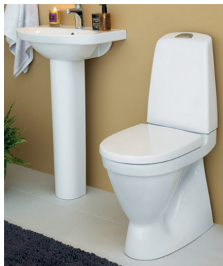
WC-istuin Nautic 1500 Hygienic Flush, piilo S-lukko

Valikoimassa on kolme erilaista seinä-WC:n asennustelinettä: Triomont XS – korkea malli, jossa painike tulee seinään, Triomont XT – matala malli, jossa painike tulee väliseinän päälle ja Triomont XS Vario – korkea malli, jossa painike tulee seinään. Triomont XS Vario soveltuu erityisesti sairaaloihin ja muihin hoitolaitoksiin, sillä sen korkeutta voidaan säätää vielä WC-istuimen asennuksen jälkeenkin.