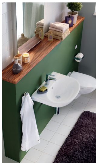
Seinä-WC Nautic 5530, Triomont-asennusteline