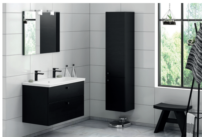
Artic allaskaappi ja korkea kaappi, musta tammi, Artic peili, valaistus LED-lampuilla