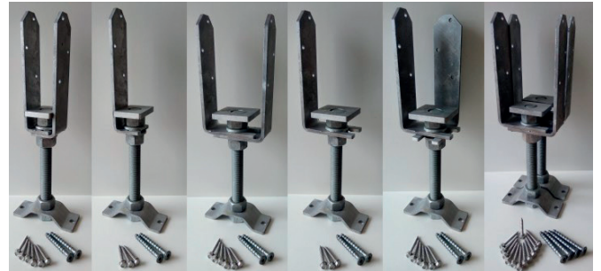
vakio pieli XL XL pieli XL nurkka XL tupla

Asennuskorkeudet 125, 150, 175, 200, 225, 250, 300 ja 350 mm