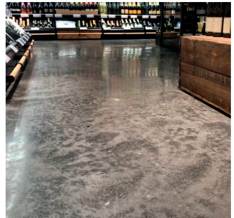
Töölön Alko, Helsinki / KCF

DesignHard on kovabetonityyppinen lattiapinta. Tyypillinen kerrospaksuus on 10–20 mm, joka hiotaan ja kiillotetaan. DesignHard-lattioiden kulutuskestävyys on erittäin hyvä ja paksun pintauksen ansiosta lattia on merkittävästi pitkäikäisempi kuin kevyemmät Designbetonilattiaratkaisut. DesignHard-tuotteet levitetään yleensä kovettuneelle betonilattialle sekä uudis- että korjausrakentamisessa. Myös tuoretta-tuoreelle menetelmä on mahdollinen mutta silloin tulee pitää huolta, että pinta on riittävän paksu eikä tuote sekoitu alusbetoniin. DesignHard lattiat voidaan toteuttaa luokissa A-C/1–4 tuotetyypistä riippuen.