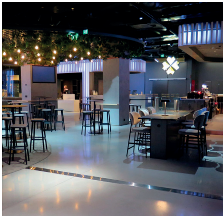
Tampereen Casino / TRU PC