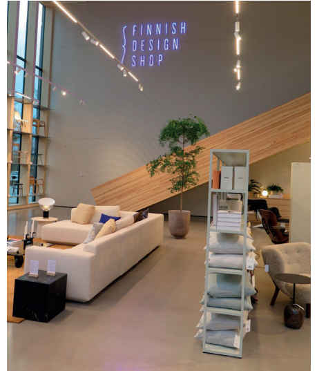
Finnish Design Shop, Turku

Yksinkertaisin tyyppi on DesignBase. Se on käytännössä perusbetonilattia, joka hiotaan ja kiillotetaan tilaajan/arkkitehdin määrittelemään asteeseen. Hionnan ja kiillotuksen lisäksi DesignBase-lattian ulkonäkö tulee käytettävästä betonista, jossa voidaan säädellä esim. raekokoa, kiviainestyyppiä ja väriä. Korjausrakentamiskohteissa kohteena on vanha betonilattia (ellei valeta kokonaan uutta), jolloin ulkonäössä on mukana vanhaa nostalgiaa.