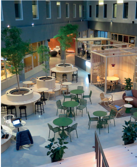
VALO Hotel&Work, Helsinki