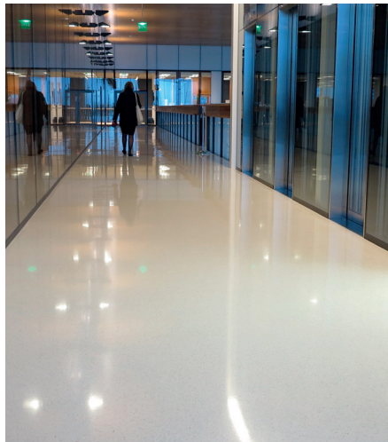
Lähitapiola, Espoo / Granidur Bianco