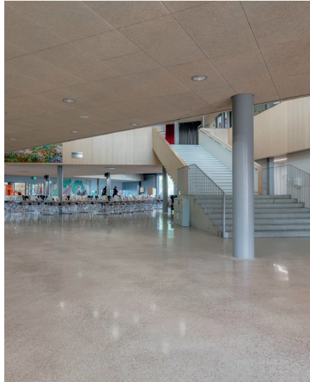
Nikkilän sydän, Sipoo