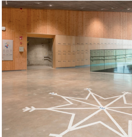
Opimäen koulu, Espoo