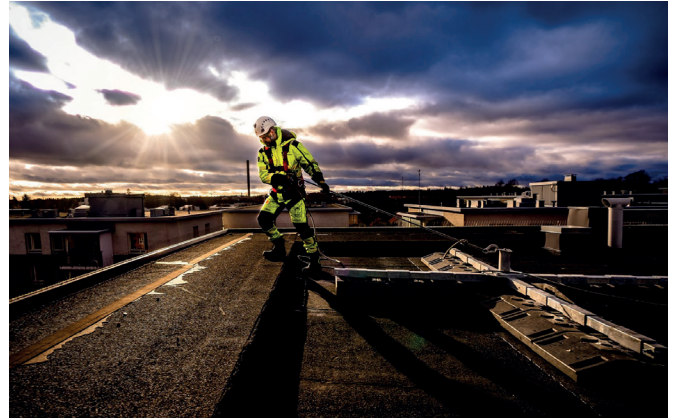
Vastapainopollari VPP 200