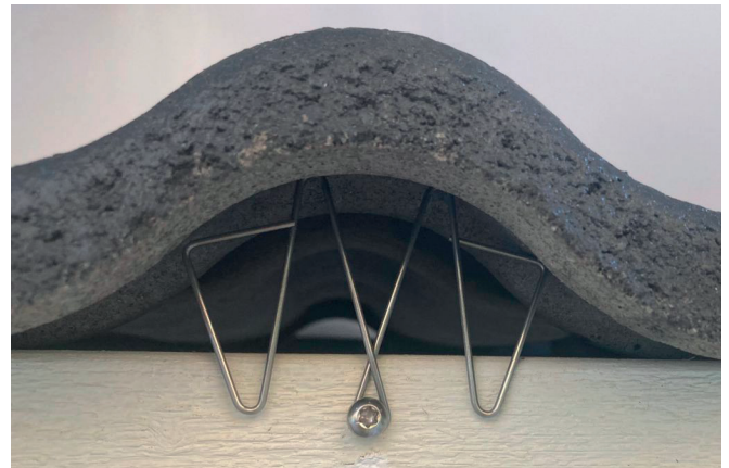
No Birds -oravaeste asennettuna