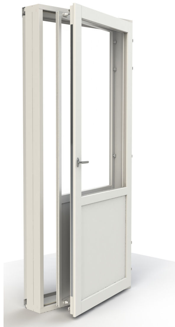
MSE1-A-RA -oven sisälehdessä on eristyslasi, ulkolehdessä tasolasi. Kuvassa umpiosallinen ovi.

Oven minimikoko 690x1790 mm ja maksimikoko 1190x2290 mm. Välikarmitillisen oven maksimileveys on 2390 mm / maksimikorkeus 2290 mm.