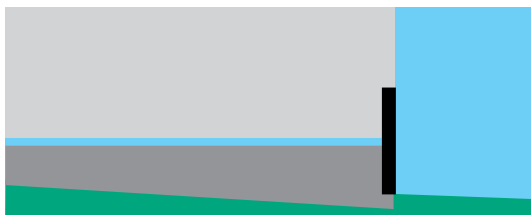
Yläkuva: Hyvin usein betonivaluissa valu jää hieman vajaaksi muotin pinnasta.