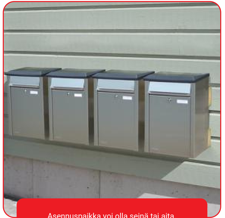
Asennuspaikka voi olla seinä tai aita.