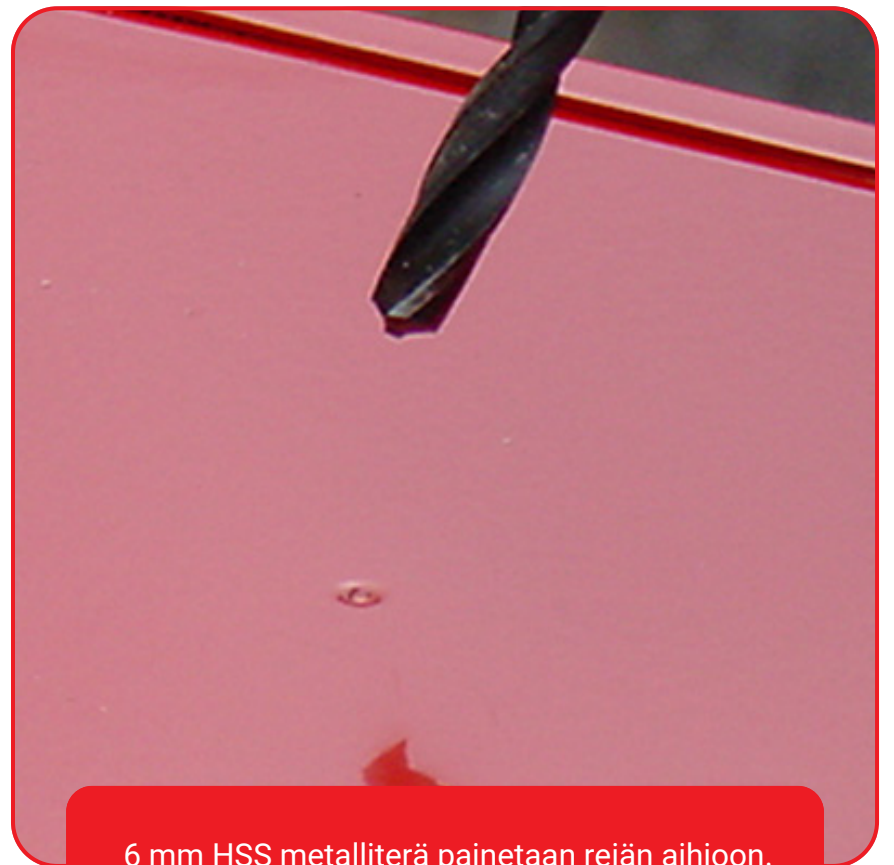
6 mm HSS metalliterä painetaan reiän aihioon.