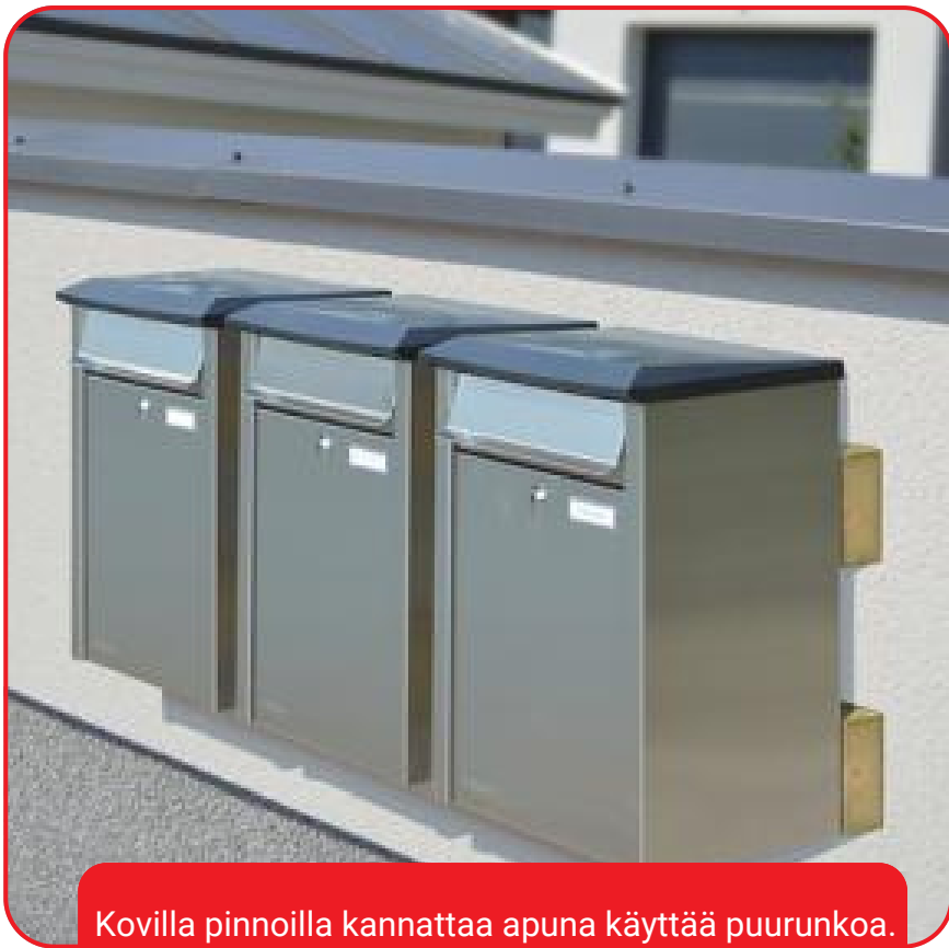
Kovilla pinnoilla kannattaa apuna käyttää puurunkoa.