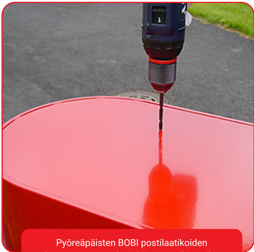
Pyöreäpäisten BOBI postilaatikoiden takaseinässä on valmiit kiinnitysreikien aihiot.

Huom! Ennen kuin seinään tehdään reikiä varmistetaan, että sijaintipaikka sijaitsee juuri siinä missä pitääkin ja että täyttöluukut ovat postin suosittelemalla korkeudella. Mittatietoja asennusta varten löydät tästä .