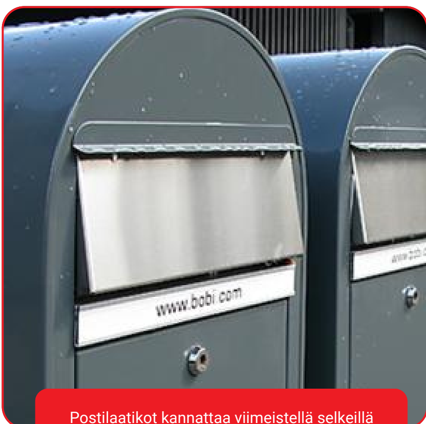
Postilaatikat kannattaa viimeistellä selkeillä nimikilvillä.