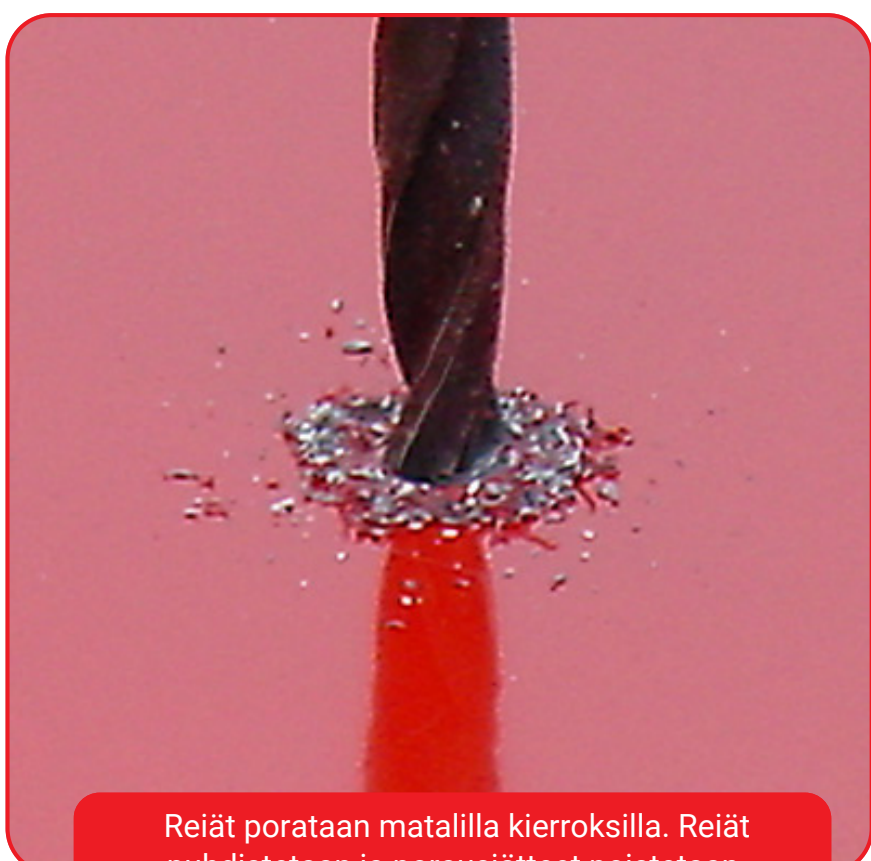
Reiät porataan matalilla kierroksilla. Reiät puhdistetaan ja porausjätteet poistetaan huolellisesti esim. imuroimalla.