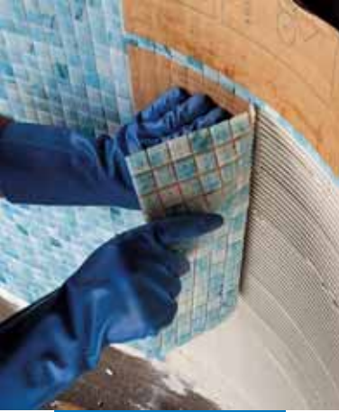
Lasimosaiikin (2x2 cm) asennus uima-altaaseen