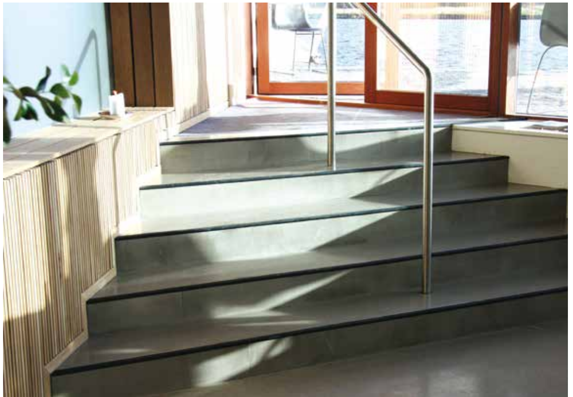
Café 8TALLET, København