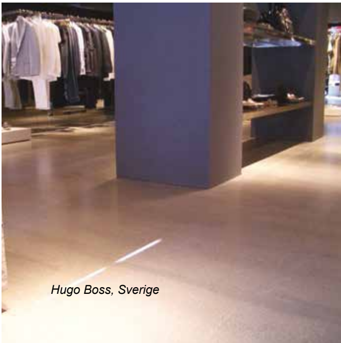
Hugo Boss, Sverige