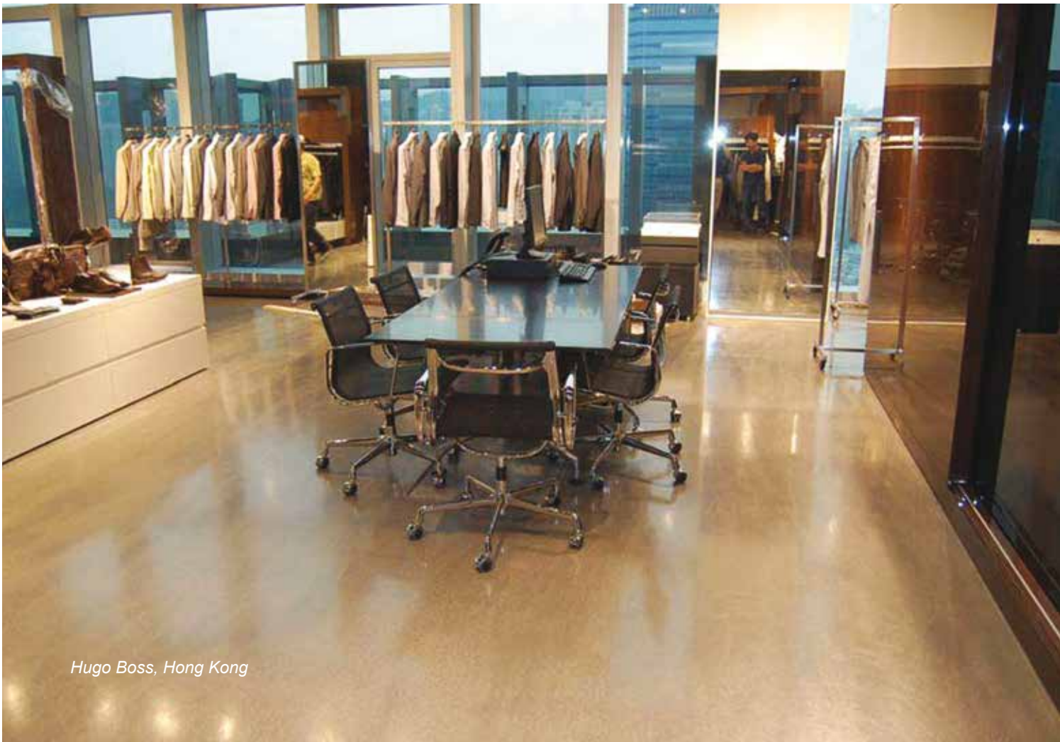
Hugo Boss, Hong Kong