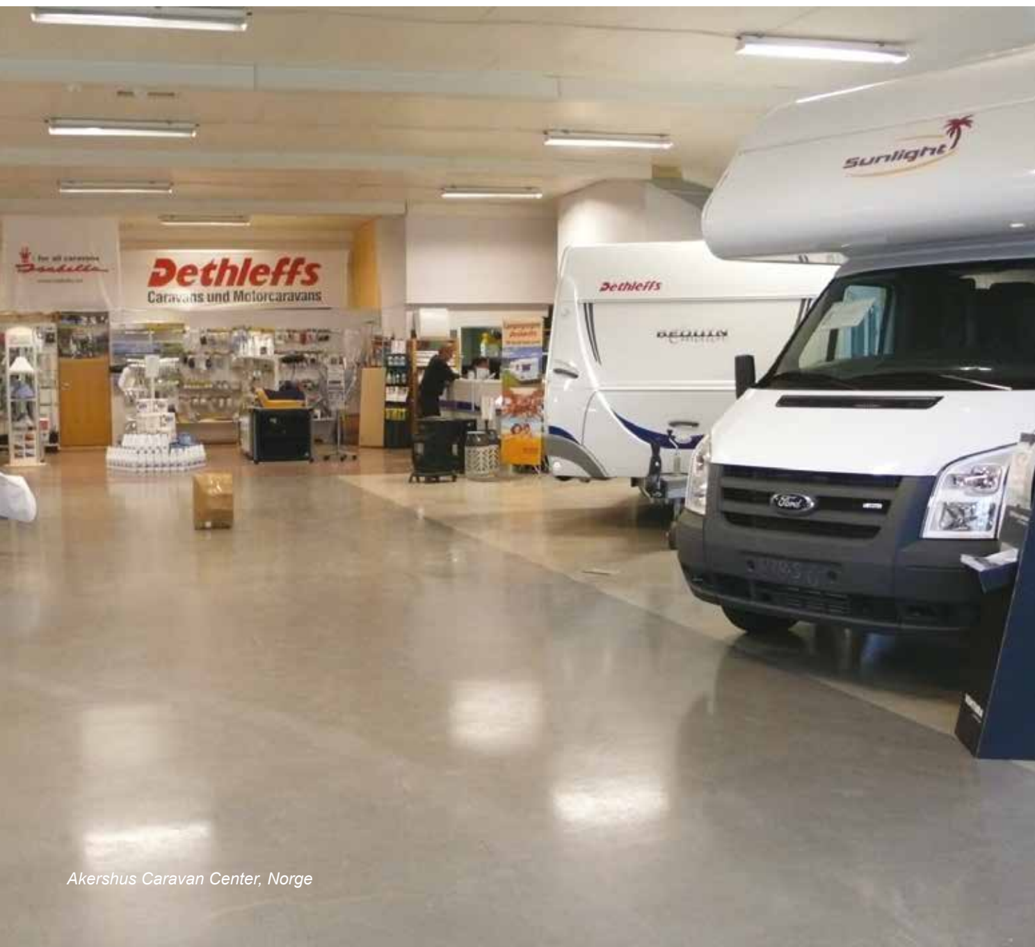
Akershus Caravan Center, Norge

Virksomheder verden rundt vælger i dag et weber.floor designgulv for at skabe nøjagtig det samme image på deres hovedkontor som i deres kædebutikker.