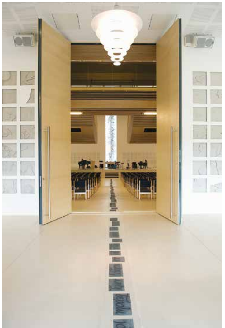
Orstad Kirke, Norge