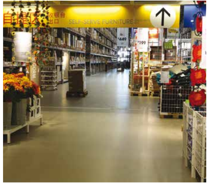
IKEA, Shenzhen, Kina