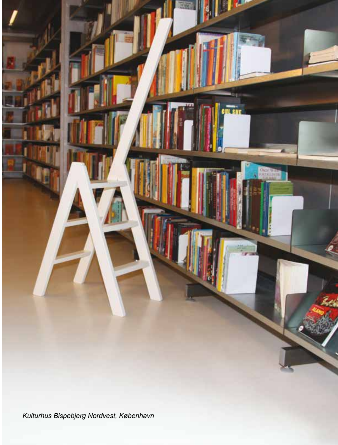
Kulturhus Bispebjerg Nordvest, København