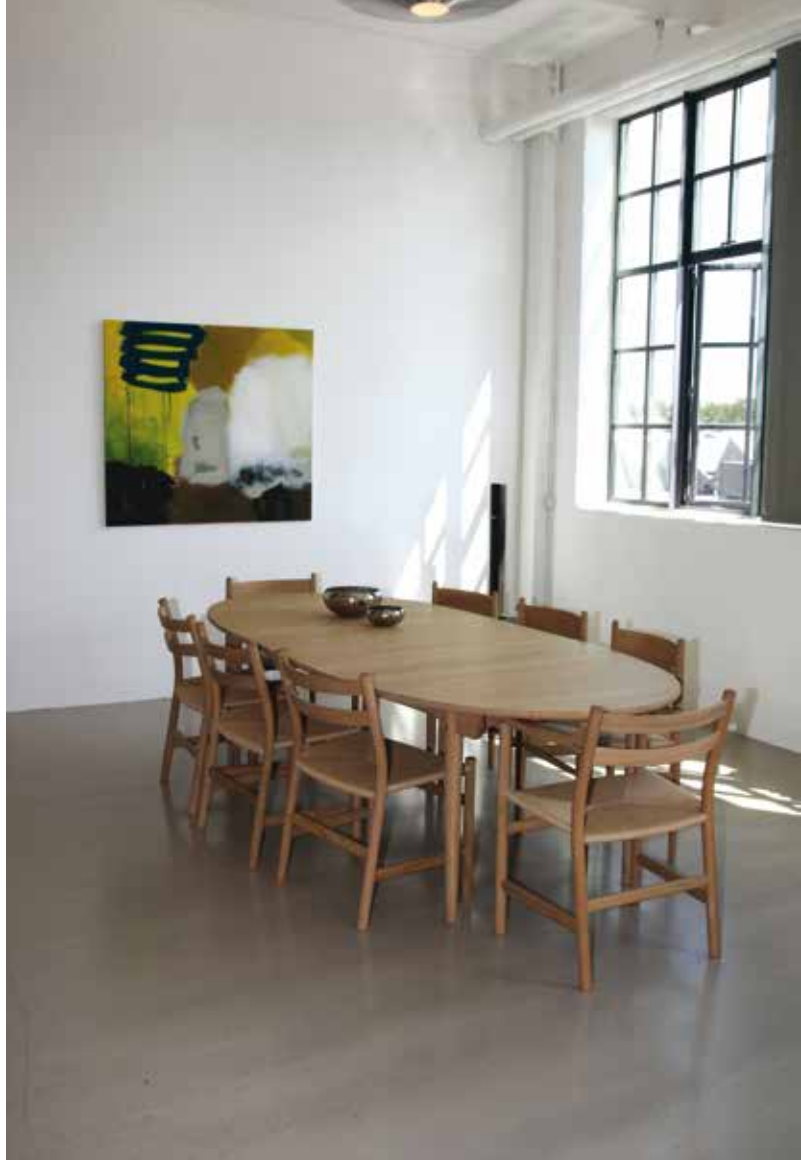
Carl Hansen & Søn, møbelhus, København