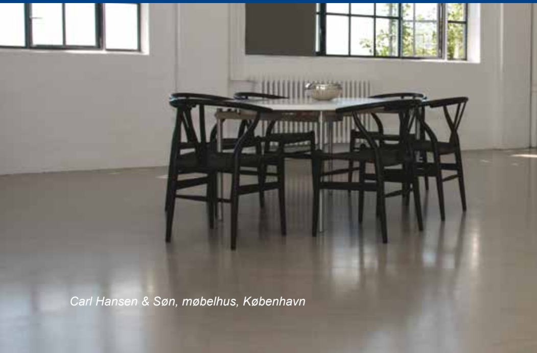
Carl Hansen & Søn, møbelhus, København

Weber er verdens førende leverandør af avancerede cementbaserede gulvprodukter og -koncepter med mere end 35 års erfaring.