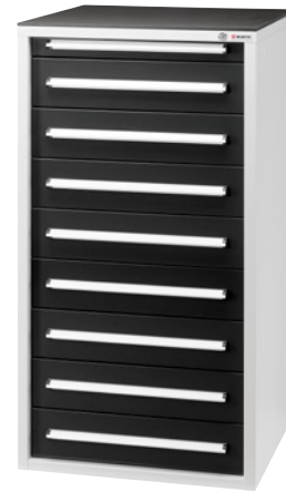
Kuva on viitteellinen