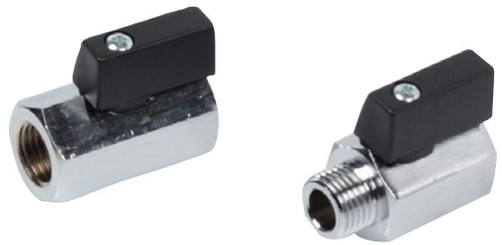
Kuva on viitteellinen