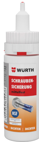
Kuva on viitteellinen