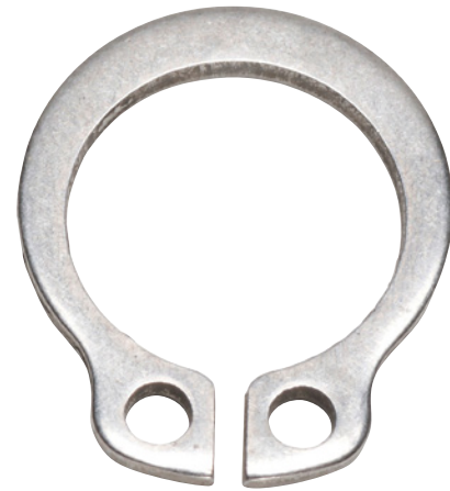
Kuva on viitteellinen