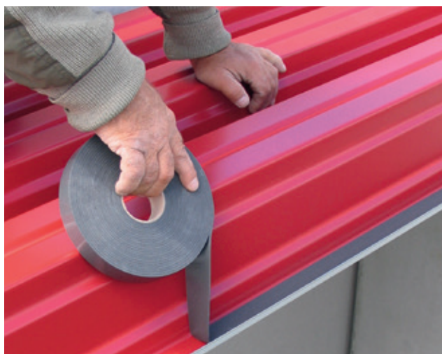
Asennuskuvan esimerkituote: ISO-ZELL FIX-TAPE