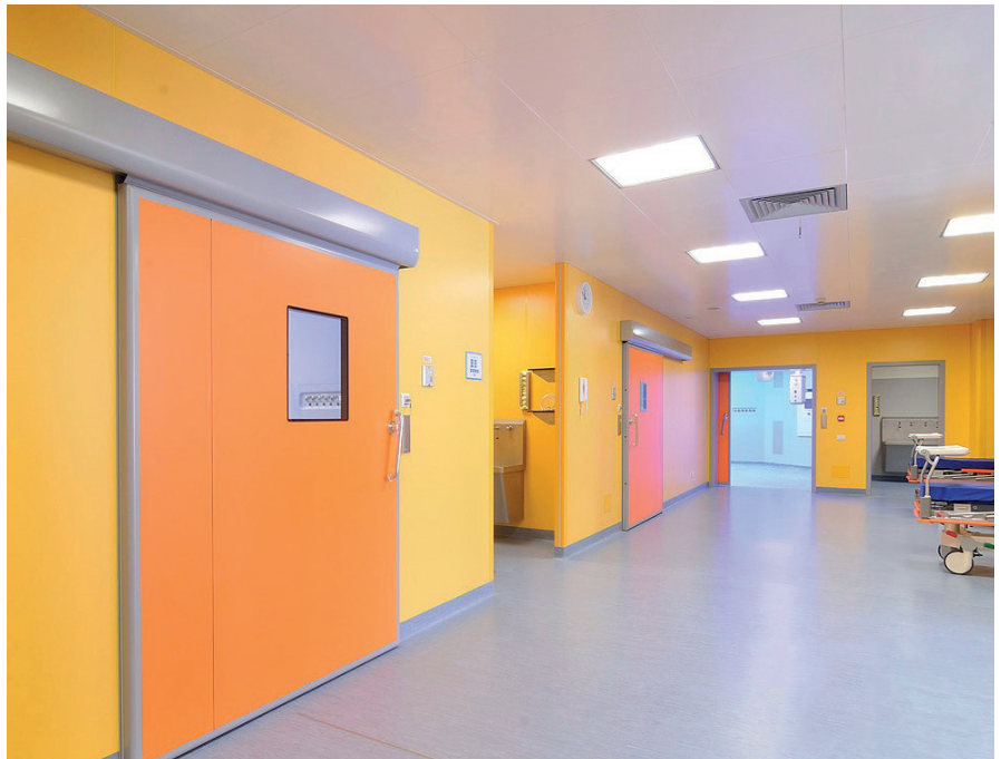
Ovissa on helppohoitoinen, hygieeninen ja kulutusta kestävä materiaali. Laaja väriskaala mahdollistaa yksilöllisen suunnittelun.

Ovi liikuu vaakasuoraan. Kaksipuoliset tiivisteet painautuvat oven kehysten pystysuoriin profiileihin kiinnitettyjä tiivisteitä vasten. Oviavun vaakasuorissa reunoissa oviavun ylä- ja alareunan tiivisteet painautuvat kehysten vaakasuoraan profiilia ja lattiaa vasten.