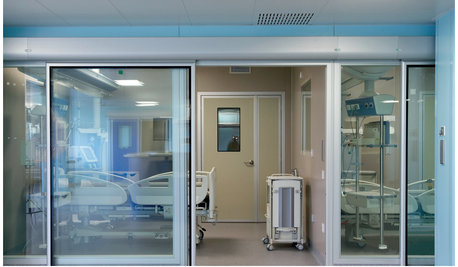
Täyslasiset liukuovet ovat tyylikkää ja helpottavat hoitotyötä.

Hermetel Lindo®-ovet on kehitetty sairaaloiden ja terveydenhuollon vaatimuksiin yli 30-vuoden kokemuksella. Mallistoon kuuluu ilmatiiviitä ja hermeettisiä liukuovia sekä saranallisia ovia. Hermetel Oy myy ja edustaa SHD Italia S.r.l.:n valmistamia Lindo ovia Skandinaviassa. Hermetel Lindo®-ovia voidaan käyttää uudiskohteiden lisäksi julkisten ja yksityisten sairaaloiden ja klinikoiden peruskorjauksissa ja uudistuksissa. Ovet mahdollistavat projektien toteutuksen EU:n viimeisimpien leikkaussalistan- dardien mukaisesti. Ovet soveltuvat myös Inoroom™-leikkaussalikokonaisuuteen.